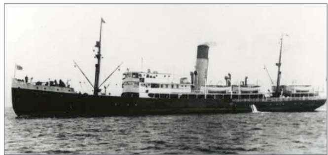
S.S. Caribou

1942 et 1944 a porté la guerre jusque dans les eaux territoriales canadiennes, et même en sol canadien. En raison de la censure du temps de guerre, les pires détails sur la meute de loups nazis en maraude ont été cachés aux peuples canadiens. À mesure que les navires explosaient,