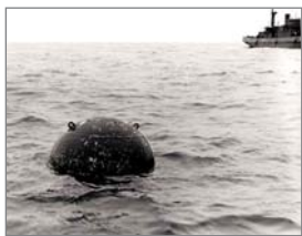
German contact mine in waters off Nova Scotia, 2 juin 1943.