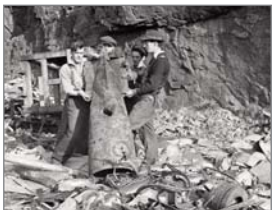
Quai Scotia après l'attaque à la torpille Photo : Gerald Milne Moses Bibliothèque et Archives Canada (PA-188854)

se sont déroulées « là bas », quelque part loin du Canada. L'attention de la Deuxième Guerre mondiale se porte surtout sur l'Europe, et une certaine attention est accordée à la guerre dans le Pacifique, en Afrique du Nord et en Birmanie. Des batailles en sol canadien ou dans les eaux canadiennes? Depuis 1812, Il n'y en a certainement pas eu d'autres!