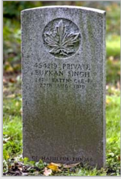
La tombe du soldat Buckam Singh est la seule tombe de soldat sikh canadien connue au Canada.