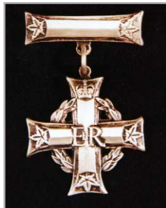
Memorial Cross GRVI