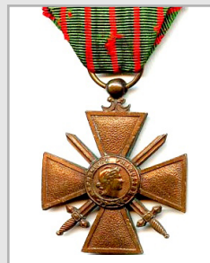
Croix de guerre

Les Allemands aperçurent Cher Ami s'envoler d'un buisson et firent feu. Durant plusieurs minutes, Cher Ami poursuivit son vol sous une pluie de balles avant d'être atteint. Les soldats d'infanterie américains regardèrent avec consternation leur dernier espoir plonger vers le sol. Puis, par miracle, Cher Ami redéploya ses ailes et se mit à monter de plus en plus haut, hors de portée des tirs ennemis. L'oiseau blessé arriva à destination et le soldat chargé des messages le trouva gisant au sol, le dos couvert de sang. Cher Ami avait perdu un œil et avait un trou de la taille d'une pièce de 25 cents dans la poitrine. Fixé à sa patte blessée se trouvait la cartouche d'argent contenant le message qui sauva la vie du bataillon.